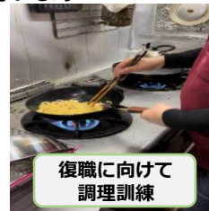
復職に向けて調理訓練